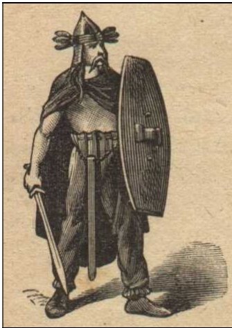
Un guerrier gaulois

L'armée romaine, très puissante et bien organisée, a déjà conquis de nombreux pays tout autour de la Méditerranée.