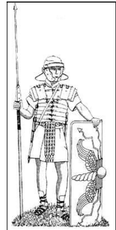
Un légionnaire romain

L'armée romaine n'est pas mieux équipée que les Gaulois, mais elle est très bien organisée, contrairement aux Gaulois qui attaquent en ordre dispersé. Les légions romaines parviennent ainsi à vaincre des armées beaucoup plus nombreuses.